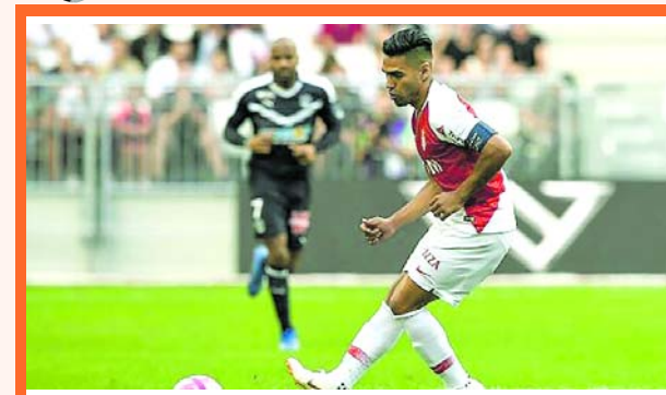
Radamel Falcao García, jugó todo el partido del Mónaco.

Fue derrota por 2-1 la que padeció Monaco en su visita a Girondins de Burdeos. El colombiano Radamel Falcao García, jugó durante todo este partido, válido por la tercera fecha de la Ligue 1.