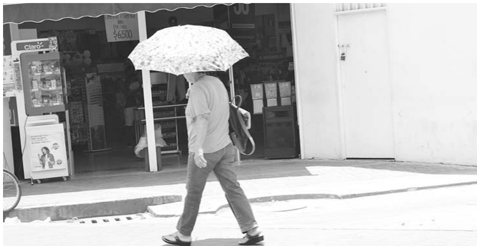
La temporada seca se prolongará hasta mediados de septiembre y no se descartan lluvias.

"De todos modos esta ola de calor es muy normal para esta época y esperamos que a medida que llegue septiembre vaya disminuyendo hasta que comience la segunda temporada de lluvias del año" dijo.