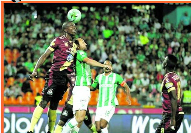
El cuadro verdolaga está obligado a sumar de a tres, si quiere continuar con vida en esta recta final

La quinta fecha del grupo A en los cuadrangulares finales de la Liga Águila II, nos trae un apasionante duelo en el estadio Atanasio Girardot de la capital antioqueña, entre el Atlético Nacional del profesor Osorio y el Deportes Tolima del entrenador Gamero. La cita está pactada para las 17:00 del domingo.