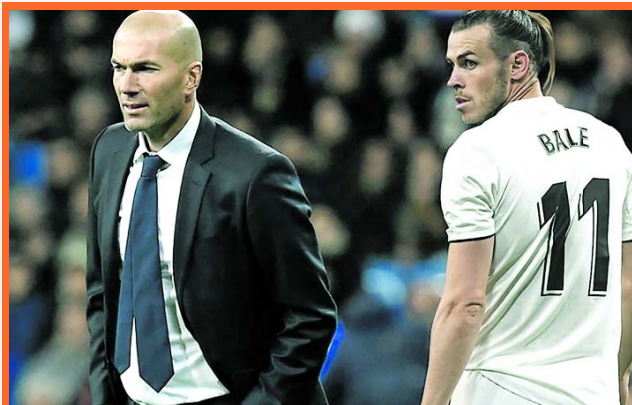
" Él se ha ido con su Selección a jugar y ahora lo recuperamos y estamos encantados".

El entrenador del Real Madrid, Zinedine Zidane, expuso su postura relacionada al polémico presente del galés Gareth Bale: "Considero también que hacemos mucho ruido con el tema de Gareth y, al final, lo más importante es concentrarnos en el fútbol porque, luego, cada uno opina y piensa. Además, creo que al final