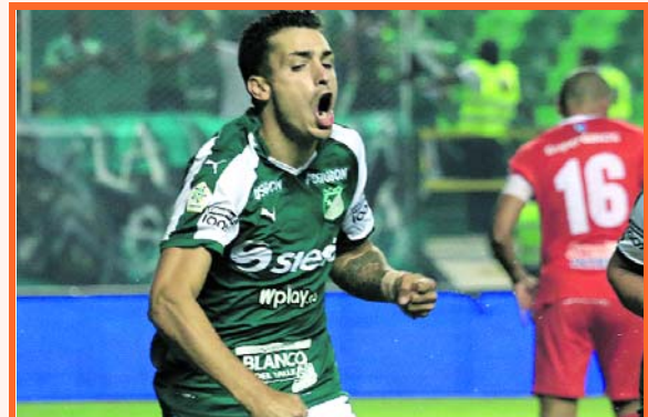
Deportivo Cali tendrá un trascendental duelo visitando a Santa Fe en el Campín