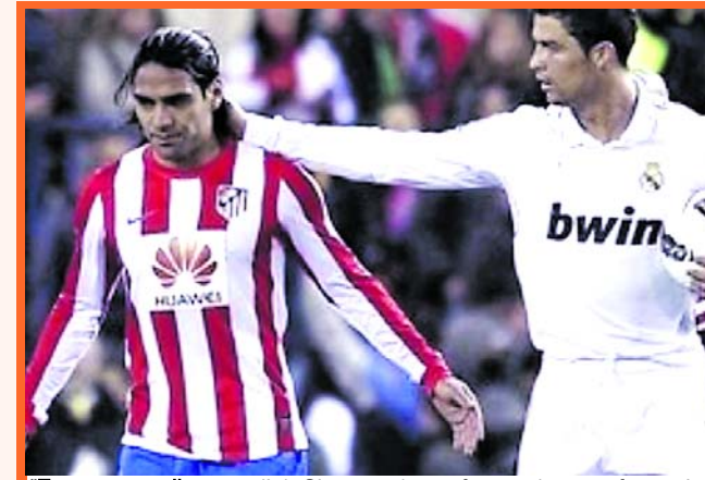
" Es una estrella mundial. Siempre hay ofertas de transferencia para él

"Se forzó a sí mismo sin entrenar. Por favor, quiero paciencia de los aficionados. Él es una persona honorable, ama al Galatasaray y a Turquía. No vino aquí por el dinero", concluyó el presidente de los leones.