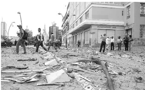
Ciudadanos adelantaron una jornada de limpieza en el CAM, el Bulevar del Río, Univalle, Unicentro, entre otros.

Al cierre de esta edición el reporte era de total calma en la ciudad.