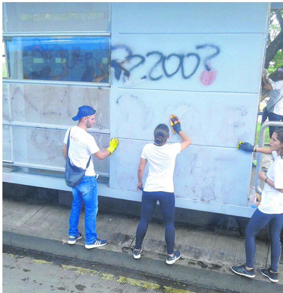
Estudiantes de la Universidad del Valle limpiaron las estaciones del MIO que fueron vandalizadas en el sur de la ciudad.